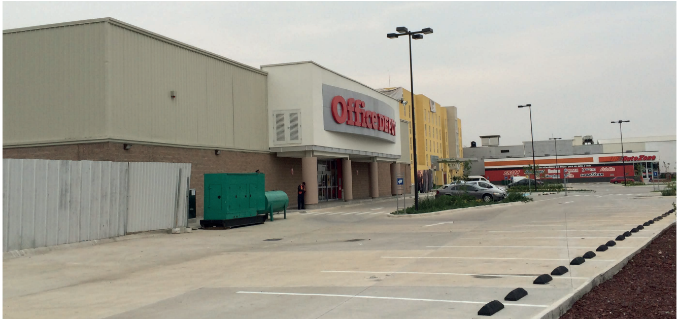
Predio Bazar Orientes Calle Hualquila Esq. Eje 6 Sur Delegación Iztapalapa.